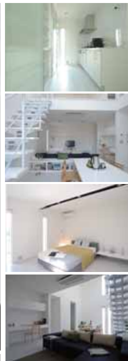
casa cube 1 1,344万円